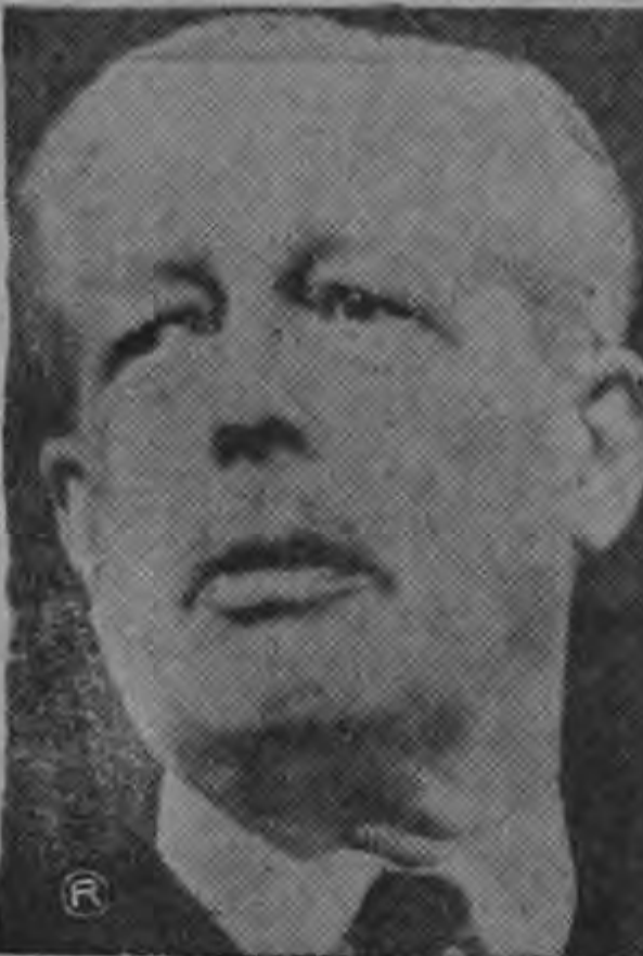
MACMILLAN ...parte de las conversaciones...