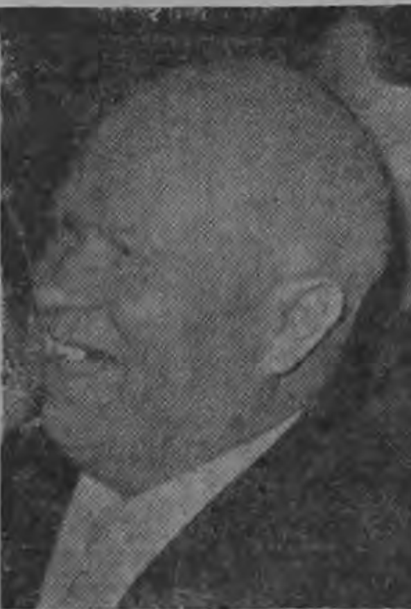
NIKITA ...parece hacer concesiones...