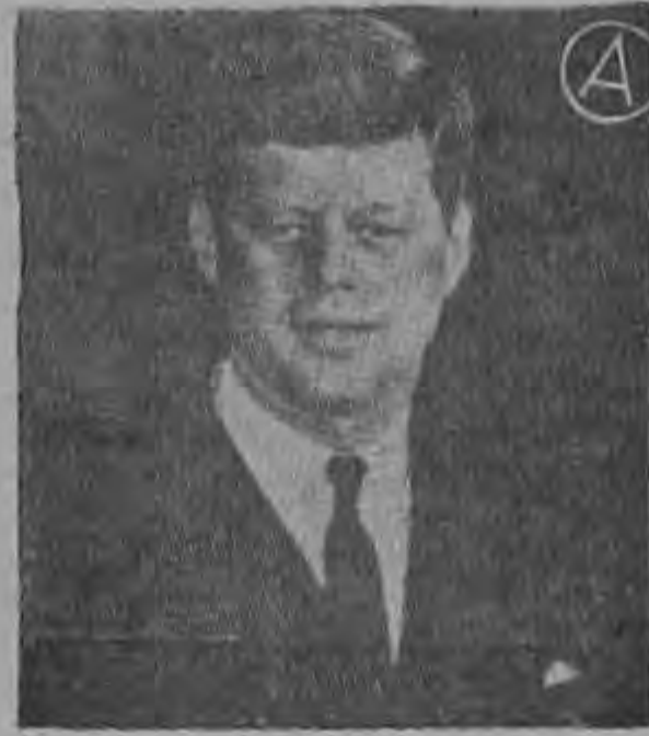
KENNEDY ...estudia el Departamento de Estado...

La proposición daría al presidente autoridad para designar países considerados como subdesarrollados.