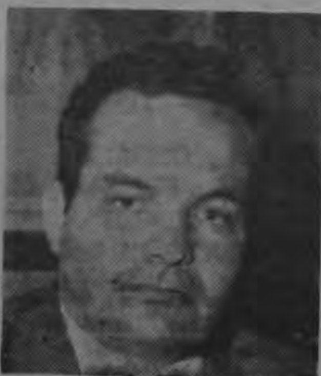
...Eg tan sólo con todo el mer-

"Es totalmente necesario que el trabajo de los centroamericanos valga más; que tenga mejor precio en los mercados internacionales.