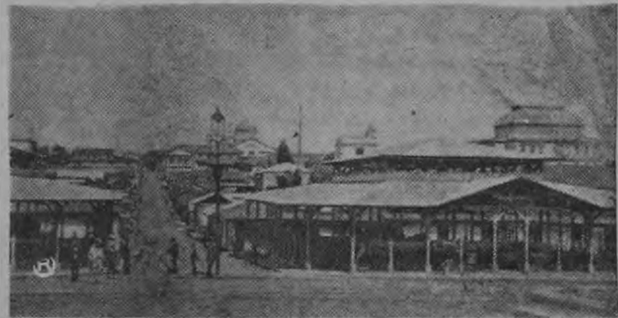
Histórica fotografía de la cuarta avenida tomada desde la explanada de la Iglesia de la Soledad. Al centro del arranque de esta avenida puede observarse la magestuosidad de los antiguos faroles. Hoy su fisonomía ha cambiado casi totalmente, sin embargo aun se conservan algunas de sus viejas casonas.